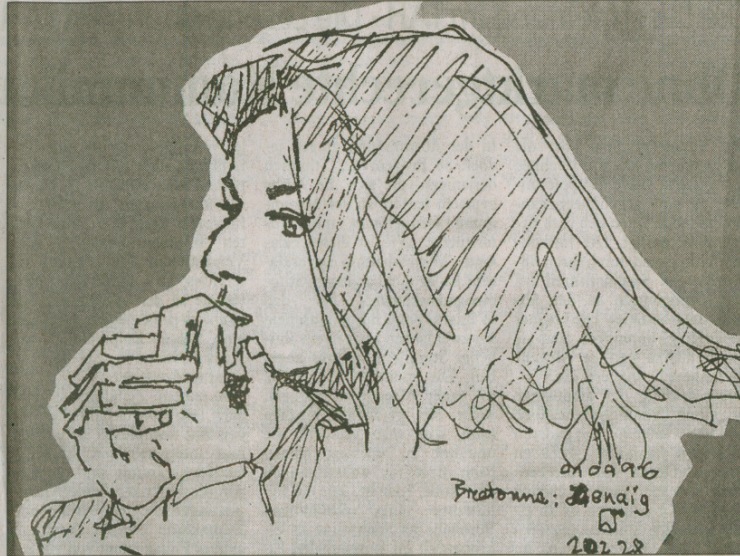
Holzminden. Breatonne, Farbradierung von 1996, von „Nante“ Scheriau.